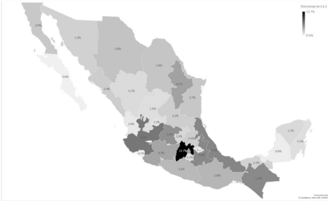
Mapa 1. Distribución del porcentaje total de niñas y niños de cero a tres años en el país